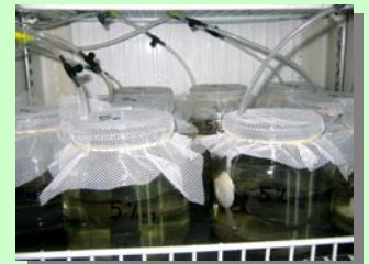
Frascos utilizados para diferentes tratamientos de dietas compuestas.

El 20% restante de cada dieta está compuesta por lípidos, cenizas y otros compuestos. Cada dieta será suministrada una vez al día a razón del 5% de la biomasa. Se utilizarán los mejores valores de temperatura y fotoperiodo obtenidos del ensayo 1. En cada acuario se colocarán tubos de PVC como refugios. La duración del ensayo será de 3 meses, al cabo del cual se medirá el peso corporal utilizando una balanza digital (1.0 ± 0.1 mg).