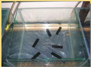
Acuario utilizado para diferentes tratamientos de temperatura y fotoperiodo.

Los juveniles serán alimentados con alimento balanceado dos veces por día a razón del 5% de la biomasa del animal. La duración del ensayo será de cinco meses, al cabo del cual se medirá el peso corporal utilizando una balanza digital (1.0 ± 0.1 mg).